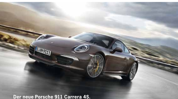
Der neue Porsche 911 Carrera 4S.