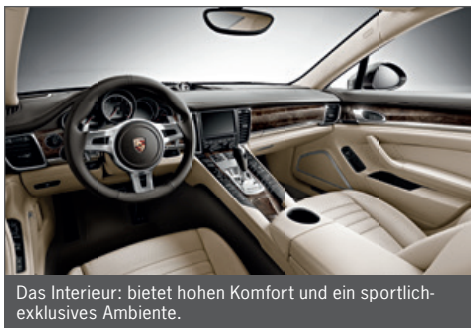
Das Interieur: bietet hohen Komfort und ein sportlich-exklusives Ambiente.