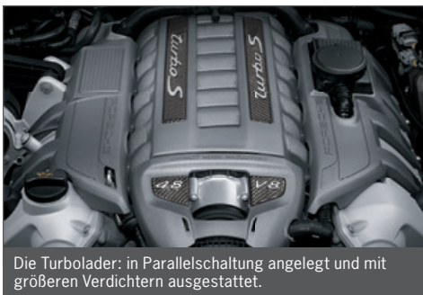
Die Turbolader: in Parallelschaltung angelegt und mit größeren Verdichtern ausgestattet.