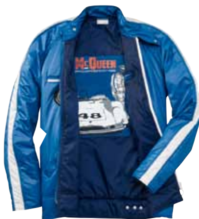
Rennjacke Damen – STEVE MCQUEEN™ Mit Porsche Stickerei auf der Rückseite und Steve McQueen Artwork auf dem Innenfutter. 100 % Polyester. In Blau. WAP 808 0XS-XXL OE | EUR 349,00*