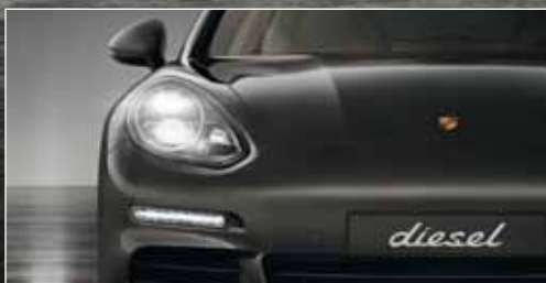
DIE BI-XENON-SCHWEINWERFER mit automatischer dynamischer Leuchtwertenregulierung sind im neuen Panamera Diesel Serie.

Was dabei herauskommt, wenn wir einen Sportwagen für die Langstrecke weiterentwickeln? Immer ein Sportwagen.