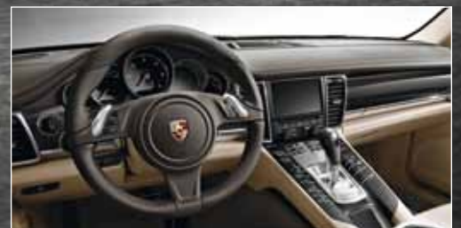
DAS MULTIFUNKTIONSLENKRAD erlaubt die komfortable Bedienung von Audio-, Telefon- und Navigationsfunktionen sowie Bordcomputer.

Mit überragender Sportlichkeit und beeindruckenden 300 PS. Bei extrem niedrigem Verbrauch und hoher Effizienz. Garantiert ohne Kompromisse.