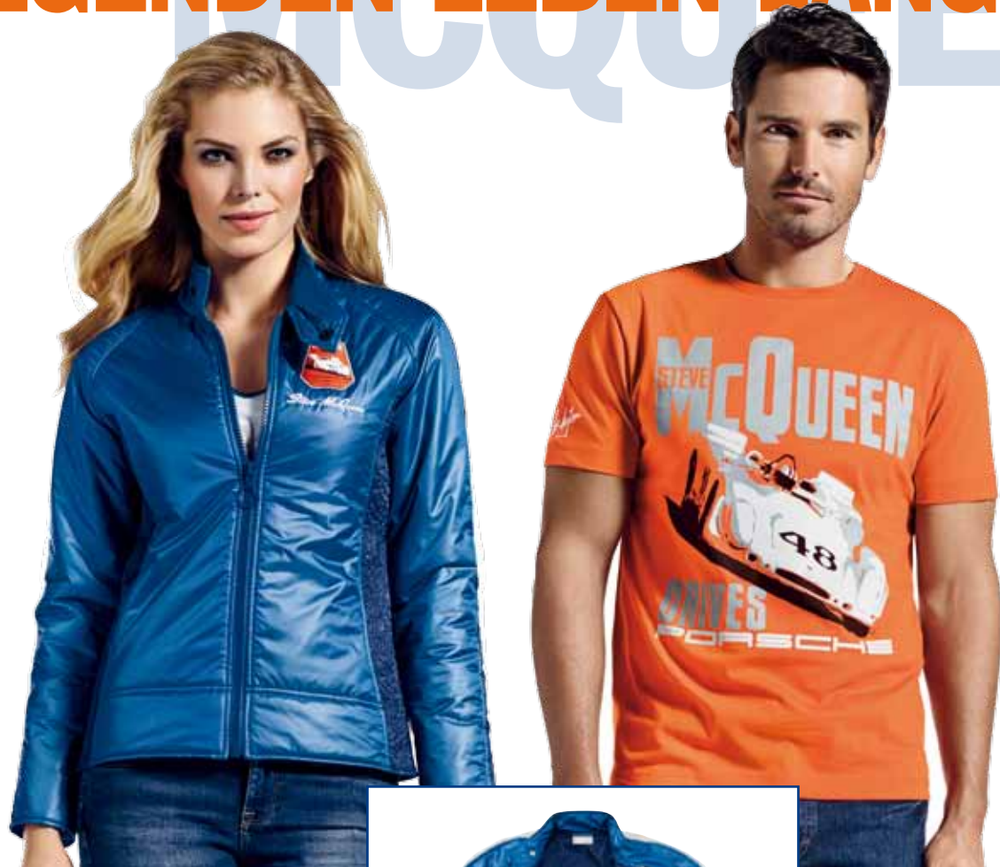
T-Shirt „Car“ Herren – STEVE MCQUEEN™ 100 % Baumwolle. In Orange. WAP 815 00S-3XL OE | EUR 59,00*