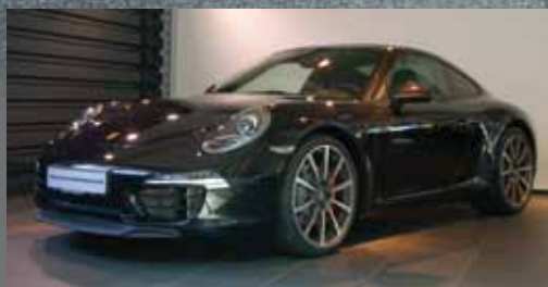
Porsche 911 Carrera S | EUR 115.781,52

Basaltschwarzmetallic EZ: 07/2013 | 3.100 km Monatliche Leasingrate: EUR 991,00 Laufleistung p.a.: 10.000 km Laufzeit: 36 Monate Einmalige Sonderzahlung: EUR 24.114,03