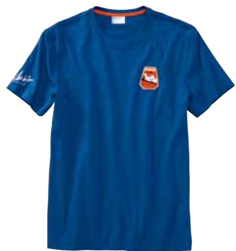
T-Shirt „Face“ Herren – STEVE MCQUEEN™ Steve McQueens Gesicht als Artwork auf der Rückseite. 100 % Baumwolle. In Blau. WAP 816 00S-3XL OE | EUR 59,00*