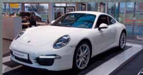
Porsche 911 Carrera 4S | EUR 106.064,28

Bei allen Fragen zu unseren Gebrauchtwagen steht Ihnen Michael Schmid unter Tel.: +49 (0) 99 31 / 7 09 - 7 06 oder per E-Mail unter michael.schmid@porsche-niederbayern.de gerne zur Verfügung.