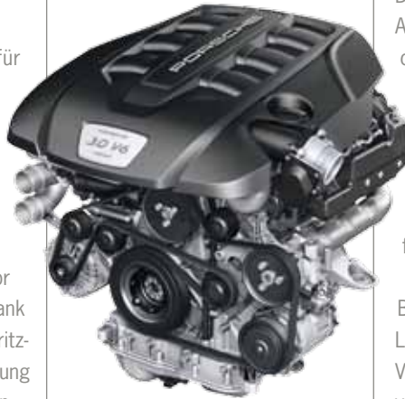
DER V6-MONOTURBO DIESELMOTOR wurde neu entwickelt und verfügt erstmals über einen wassergekühlten Turbolader mit größerem Durchmesser.

Ausgestattet mit einem V6-Monoturbo Dieselmotor bringt er eine Leistung von 300 PS – und bietet dank neu entwickelter Kolben, einem optimierten Einspritz- und Ventilsystem sowie verbesserter Ladeluftkühlung ganze 50 PS mehr als sein Vorgängermodell. Ein weiterer Grund für die enorme Leistungssteigerung: der vergrößerte Turbolader. Im neuen Modell ist er erstmals mit einer Wasserkühlung ausgestattet, die für eine optimale Wärmeabfuhr sorgt. Im Zuge all dieser Optimierungen konnte die Höchstgeschwindigkeit auf 259 km/h gesteigert werden – Porsche Performance in seiner reinsten Form.