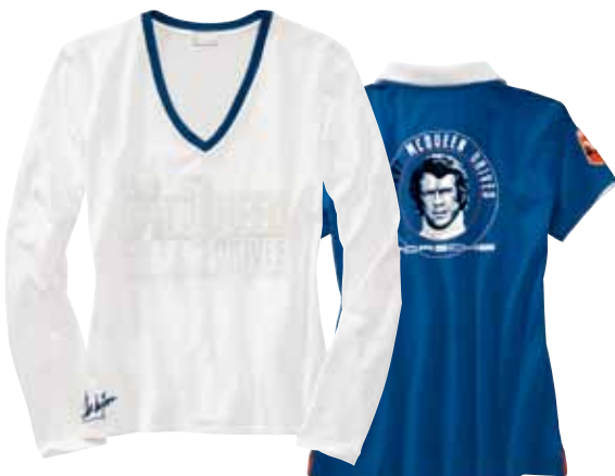
Polo-Shirt Damen – STEVE MCQUEEN™ 95 % Baumwolle, 5 % Elastan. In Blau. WAP 810 0XS-XXL OE | EUR 79,00*