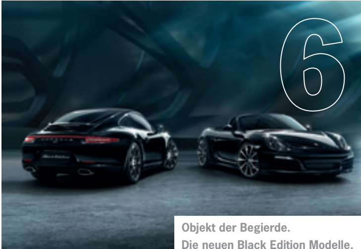
Objekt der Begierde. Die neuen Black Edition Modelle.