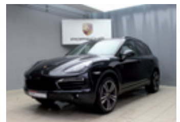
Porsche Cayenne Diesel

Tiefschwarzmetallic 07/2012 | 96.900 km EUR 54.450,-*