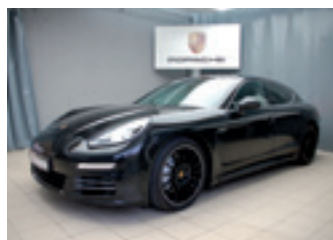
Porsche Panamera 4S

Basaltschwarzmetallic 03/2014 | 7.500 km EUR 95.790,-*