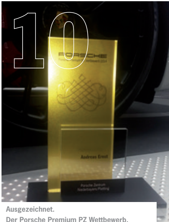
Ausgezeichnet. Der Porsche Premium PZ Wettbewerb.