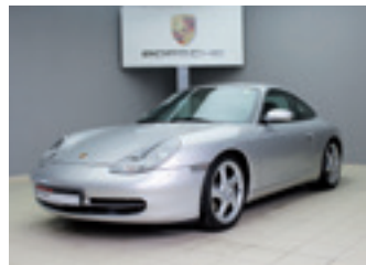
Porsche 911 Carrera

Arktissilbermetallic 04/2001 | 103.000 km EUR 25.900,-*