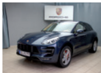
Porsche Macan Turbo

Dunkelblau-metallic 07/2014 | 38.900 km EUR 83.890,-*