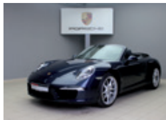
Porsche 911 Carrera Cabriolet

Dunkelblau-metallic 06/2013 | 23.500 km EUR 85.790,-*