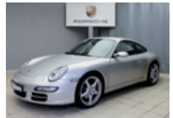
Porsche 911 Carrera S

Arktissilbermetallic 04/2005 | 91.000 km EUR 37.890,-*