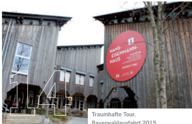
Traumhafte Tour. Bayerwaldausfahrt 2015.

Porsche Times erscheint beim Porsche Zentrum Niederbayern/Plattling, AVP Sportwagen GmbH, Dr.-Wandinger-Straße 5, 94447 Plattling, Tel.: +49 9931 709-700, Fax: +49 9931 709-710, E-Mail: info@porsche-niederbayern.de, www.porsche-niederbayern.de; Auflage: 1.750 Stück. Redaktionsanschrift: Porsche Zentrum Niederbayern/Plattling, AVP Sportwagen GmbH, Dr.-Wandinger-Straße 5, 94447 Plattling. Für unverlangt eingesandte Fotos und Manuskripte wird keine Haftung übernommen. Die Verantwortung für die redaktionellen Inhalte und Bilder dieser Ausgabe übernimmt das Porsche Zentrum. Ausgenommen davon sind die offiziellen Seiten der Porsche Deutschland GmbH.