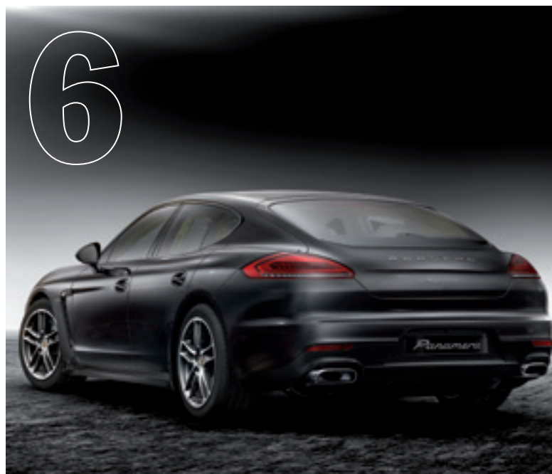
Die Kraft der Gegensätze. Die neue Panamera Edition.