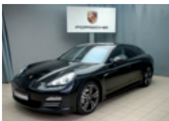
Porsche Panamera 4S

Basaltschwarzmetallic 02/2012 | 88.900 km EUR 54.890,-*