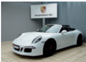
Porsche 911 Carrera GTS

Arktissilbermetallic 04/2005 | 91.000 km EUR 37.890,-*