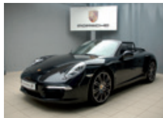
Porsche 911 Carrera S Cabriolet

Tiefschwarzmetallic 04/2015 | 4.900 km EUR 122.790,-*